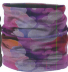
リフレクション W-16243 5