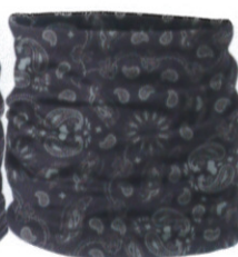
カーチフ W-16699 0