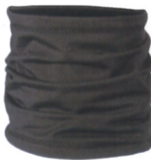
ブラック W-16429 3