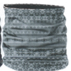
シャレー W-16700 3