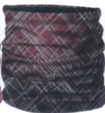
スクラッチ W-16245 9