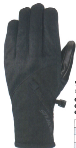
ウィンドストッパー® サイクロン ¥8,400 (税抜)