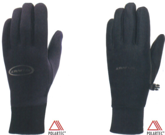
オリジナル オールウェザーグローブ ¥5,000 (税抜)

ウェザーシールド™は防水透湿機能をもつセイス独自のファブリック。縫い目はシーム加工されていないので100%防水グローブではありませんがその分発汗による蒸れを逃がしやすい効果があります。