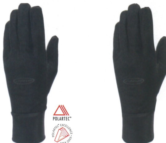
ハイパーライト オールウェザーグローブ ¥4,200 (税抜)

アウターに超薄地のストレッチナイロンを使用しておりオールウェザーグローブの約半分の重さです。高いフィット感で写真撮影等の細かな作業におすすめ。米海兵隊に制式採用されています。