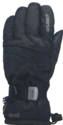
ファントム™ ゴアテックス® グローブ ¥8,400 (税抜) ●インサート/ゴアテックス® ●断熱材/ 200 g ヒートロック ●シェル/ナイロン ●パーム/ ToughTek ラバー ●カラー/ブラック