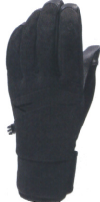
ブレード エクストリーム オールウェザーグローブ ¥8,600 (税抜)