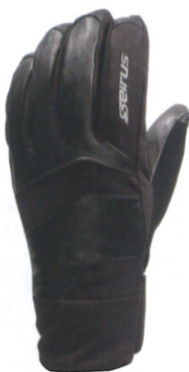
エッジ エクストリーム オールウェザーグローブ ¥9,800 (税抜)