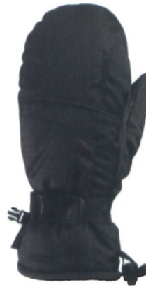
ファントム™ ゴアテックス® ミトン ¥8,400 (税抜) ●カラー/ブラック