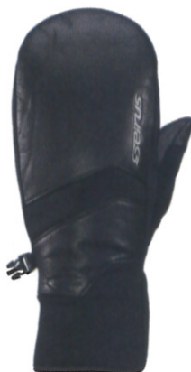
エッジ エクストリーム オールウェザー ミトン ¥9,800 (税抜)