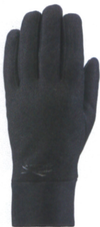
エクストリーム ハイパーライトグローブ ¥5,700 (税抜)

エクストリームオールウェザーグローブよりも 柔らかいナイロンを使用しているので軽量で快 適な装着感です。