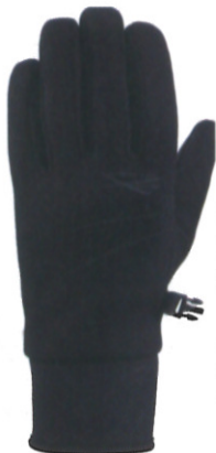
ゴアテックス® エクストリーム オールウェザーグローブ ¥9,800 (税抜) インサートにゴアテックス® を使用したモデル。 ●カラー/ブラック