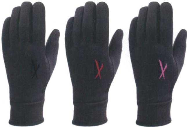
ブラック×ブラック ブラック×レッド (メンズのみ) ブラック×ベリー (レディースのみ)