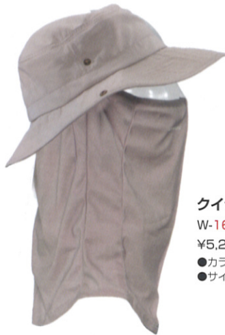
クイックシェード DX フロッピー