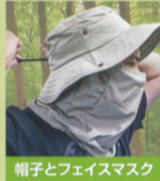
帽子とフェイスマスク