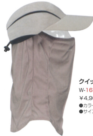
クイックシェード DX シャンディ