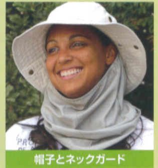
帽子とネックガード