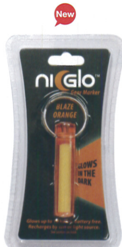
ブレイズオレンジ