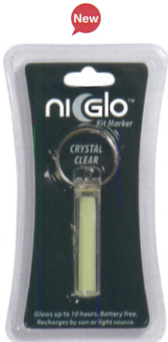
クリスタルクリア