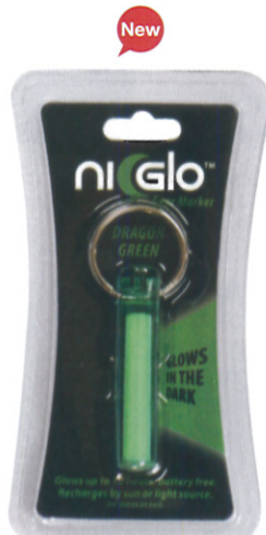
ドラゴングリーン