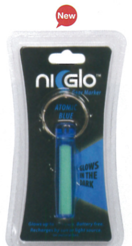
アトミックブルー