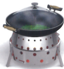
中華鍋を使った料理にも