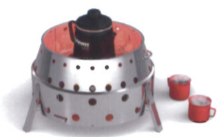
パーコマックスと一緒に