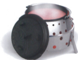
ダッチオーブンを入れ熱効果UP