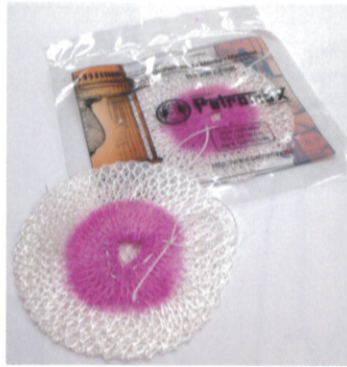
HK150 マントル 0-02158 9 ¥300 (税抜) ●1枚入り