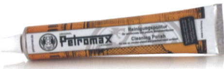
ポリッシュ 0-12514 0 ¥1,500 (税抜)