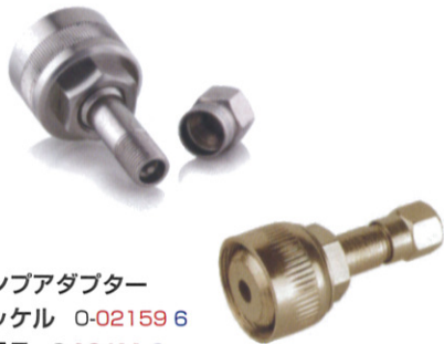
ポンプアダプター ニッケル 0-02159 6 ブラス 0-12411 2 各¥2,400 (税抜)

点灯時に放出する熱を効率よく利用する調理用トップ。ヘッドカバーの代わりに取り付けて使用します。