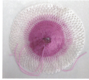
ダブルダイヤモンド 0-02171 8 ¥300 (税抜) HK500 シリーズ用アクセサリ 「マントルサポート」専用のマントルです。 ●1枚入り