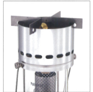
ッキングトップ (HK500 専用) 0-02174 9 ¥7,900 (税抜)

ノズルとガスチャンバーの間にセットして使用します。マントルを上下2ヶ所で支えることで灰状になったマントルが破損しにくくなります。マントルサポート用のダブルダイヤモンドが別途必要です