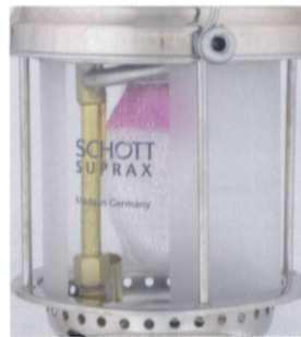
バーチカルハーフマット

ポンピングの手間を省く便利なアクセサリ。ハンドポンプの代わりに取り付け自転車の空気入れ(米式バルブ)を使って圧力をかけることができます。