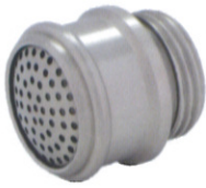
ステンレスノズル HK500 用 0-12204 0 HK150 用 0-12205 7 各¥3,000 (税抜) セラミックノズルに比べて熱効率が高く破損の心配もありません。